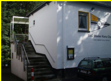
Das SKC Bootshaus