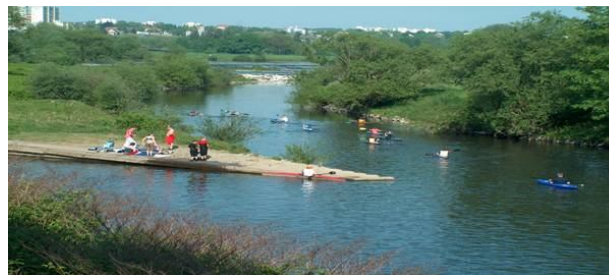
Am Spillenburger Wehr

Da wir kein Sport-Dienstleister, sondern eine auf persönlichem Einsatz und Engagement beruhende Gemeinschaft sind, müssen aktive Mitglieder (bis zum 65. Lebensjahr) 12 Std. Gemeinschaftsarbeit je Geschäftsjahr leisten.